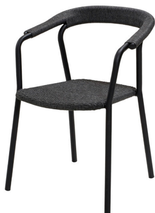
RODGAL Dark grey